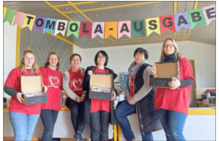
Die Tombola der FrauenUnion Köditz bei der DKMS Typisierungsaktion

veranstaltete die FrauenUnion Köditz eine Tombola. 1.355 Sachspenden und Preise wurden gesponsert - 5.800 Euro Spenden durch die Tombola können zumindest eine kleine Last von den Schultern der Familien nehmen.